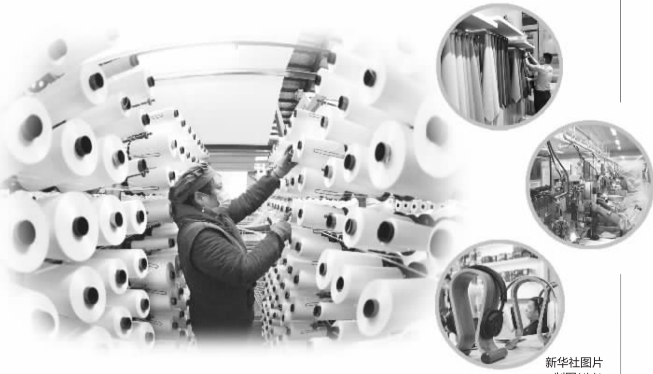
制图/苏振