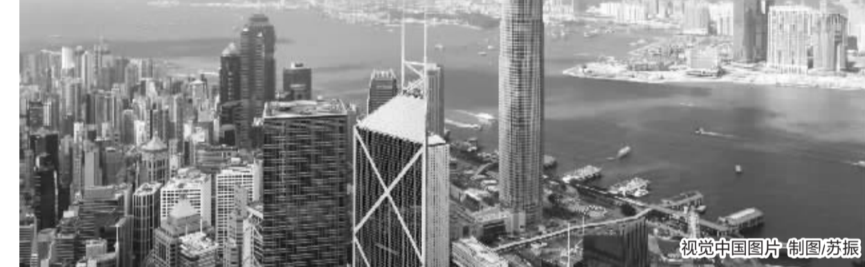
制图/苏振

功应对内外风险挑战,运行稳健,深化改革开放、服务高质量发展取得新成效。股票市场方面,设立北京证券交易所,科创板、创业板试点注册制改革顺利推进,A股总体稳中有升。2021年沪深两市共有484家企业IPO,融资5351.5亿元;546家公司完成再融资;日均成交额1.06万亿元,市场活跃度和韧性明显增强。2021年年末公募基金规模超25万亿元,创历史新高。外资保持稳步流入,2021年全年外资净流入A股市场384.6亿元,为过去五年最高水平。期货市场方面,平稳推出生猪期货,一年来运行平稳,成交持仓稳步增加,期货价格对生猪养殖企业的预期引导作用逐步显现。广州期货交易所设立,中证商品指数公司开业运营,期货市场组织和机构体系进一步完善。首批商品期权品种作为特定品种引入境外投资者参与交易,对外开放进一步深化。2021年期货市场日均成交3092.48万手,日均持仓2795.96万手,均创历史新高。期货市场服务实体经济的能力明显提升。交易所债券市场方面,市场运行总体平稳,2021年全年新发行债券约8.7万亿元。总的看,2021年内地资本市场服务实体经济力度和效果明显增强,实现了量质双升。