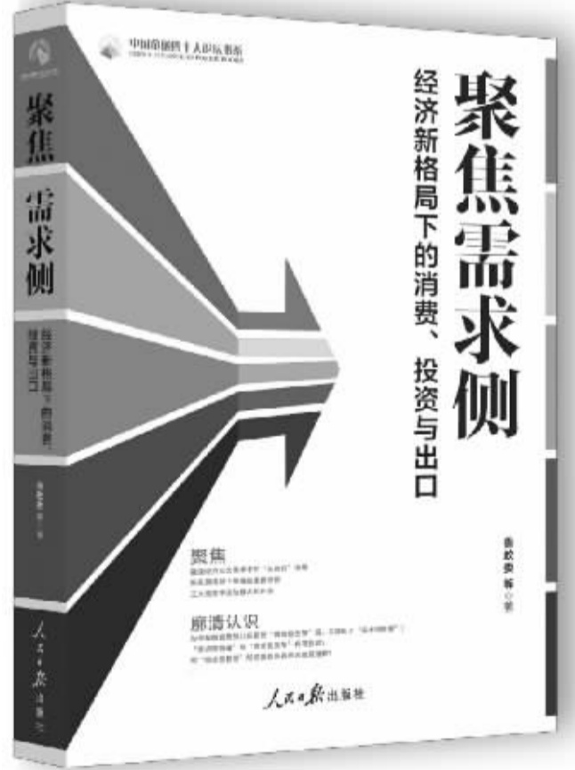
书名:《聚焦需求侧》 作者:鲁政委 等 出版社:人民日报出版社

要构建以内循环为主体的发展格局,必须努力扩大中国居民的消费需求。对此,作者提出了三条重要建议。一是通过创造更多就业、完善收入再分配机制来提高中低收入群体的购买力。二是通过进一步健全社会保障机制来消除居民消费的后顾之忧,尤其是在人口老龄化加剧的背景下,大力夯实居民养老保障至关重要。三是丰富居民投资理财渠道,增加居民财产性收入。此外,通过分析美国非耐用消费品、耐用品与服务消费结构的变化,作者提出,药品、娱乐用品、保健医疗设备、医疗服务支出、汽车售后服务市场、体育用品、宠物消费、金融服务、教育服务、法律服务等领域未来在中国的增长前景非常广阔。