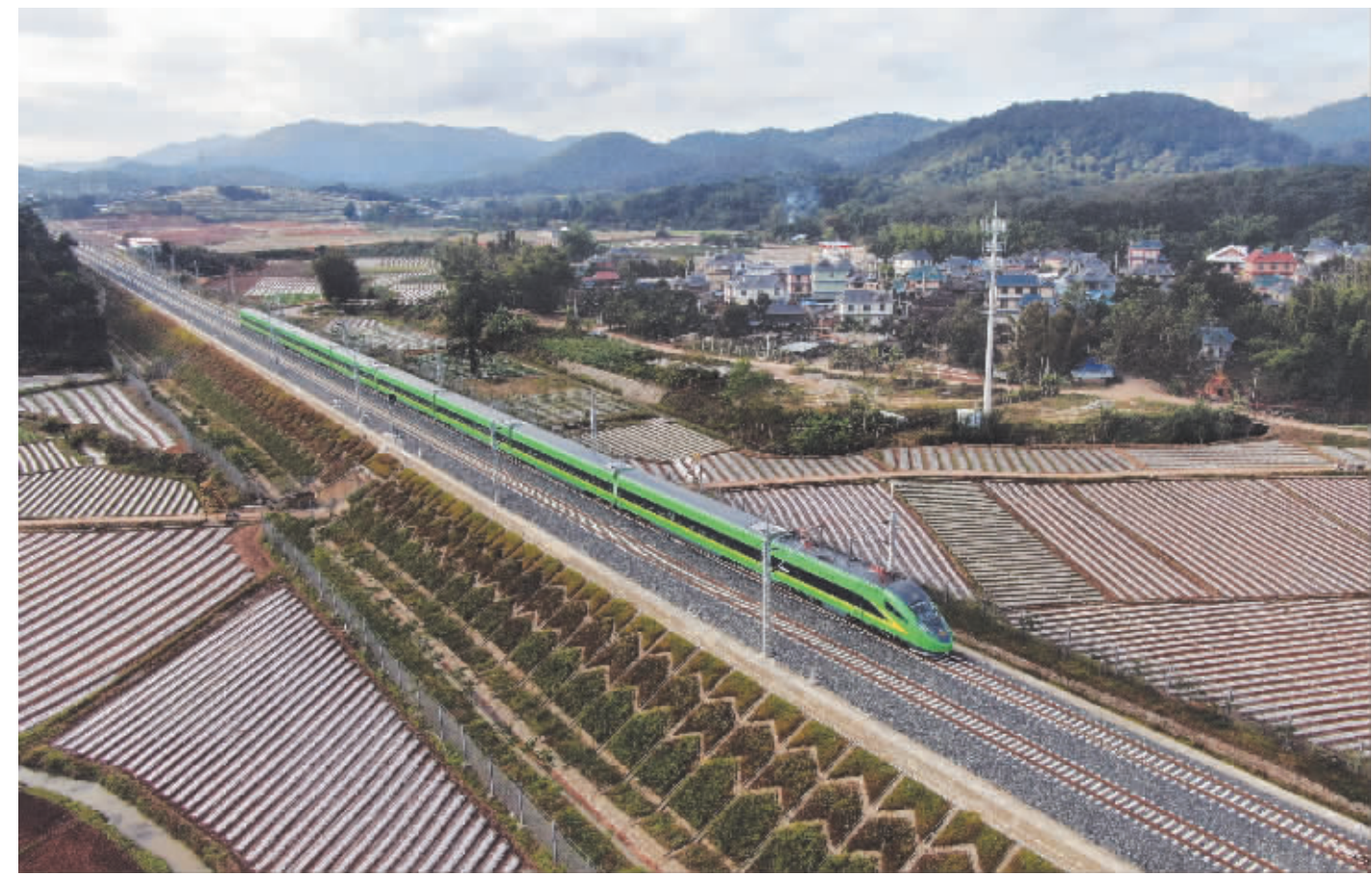
中老铁路“满月” 客货运输两旺 1月3日，列车行驶在位于云南西双版纳傣族自治州景洪市境内的中老铁路上(无人机照片)。 2021年12月3日，中老铁路正式开通运营。一个月来，这条北起中国昆明、南至老挝万象的国际铁路，客货运输两旺。记者3日从中国铁路集团有限公司获悉，开通运营一个月来，中老铁路累计发送旅客67万人次，发送货物17万吨，交出“满月”亮眼成绩单。

进入2022年，各家银行正积极备战信贷“开门红”。多位业内人士预计，今年一季度新增信贷有望实现同比增长，全年商业银行信贷规模也将保持稳步增长，绿色金融、“专精特新”企业等将是信贷投放的重点领域。 人民银行强调，增强信贷总量增长的稳定性，稳步优化信贷结构。中信证券研究所副所长明明表示，近期一系列政策工具及官方表态均指向增强信贷总量增长的稳定性，未来结构性政策工具也将持续助力信贷增长。另外，考虑到LPR利率下调、按揭贷款放款提速、新经济和绿色产业领域政策倾斜潜力大，以及财政发力拉动基建投资等因素，贷款融资需求潜力很大。 “预计年初信贷投放力度将有明显提振，整体结构较此前也会有所改善。”明明表示，2022年1月贷款投放可能超过2021年同期的3.58万亿元，考虑到商业银行信贷投放节奏，预计一季度新增贷款将超过8.5万亿元，而去年一季度人民币贷款增加7.67万亿元。 光大证券固收首席分析师张旭认为，在全面降准、LPR降息“量价组合”的政策推动下，以及在“增强信贷总量增长的稳定性”的目标指引下，预计2021年12月信贷增长不会差，货币信贷的合理增长将得到保持。此外，历年1月都是信贷集中投放的月份，2022年亦不会例外。而且，在中央经济工作会议“政策发力适当靠前”的要求下，2022年信贷“开门红”的特征可能更为鲜明。 但某国有大行浙江地区二级分行负责人在接受中国证券报记者采访时表示：“从信贷投放看，目前项目储备较多，预计2022年一季度投放规模和2021年同期差不多。” 对于2022年信贷投放重点，上述负责人认为，当前国际国内经济形势不确定因素较多，企业扩大再生产和投资意愿会有所减弱，企业固定资产贷款投放将会放缓。新兴技术产业、高端智能制造产业仍是2022年重点投放领域，政府类投资仍为中长期信贷需求的主要领域。 此外，多家银行均提出将加大对“专精特新”企业的支持。例如，北京银行日前发布了“专精特新”企业专属信贷产品——“专精特新领航贷”，并将通过分层次条件准入，实现对企业的精细化额度匹配，打造多梯度的客户培育机制，从授信额度、利率成本等多方面给予企业支持。