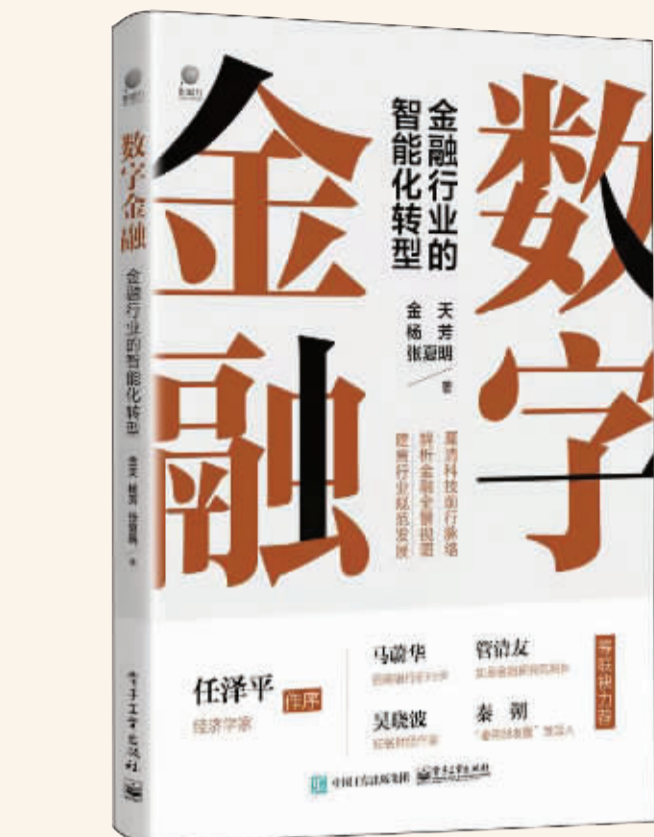
书名:《数字金融》 作者:金天 杨芳 张夏明 出版社:中国工信出版集团

逆水行舟，不进则退。坚守是必要的，但转型又是企业不得不直面的挑战。TCL能够坚持这么多年，其实也是不断转型的结果。2009年投资华星也被外界说成豪赌，当时项目如果做砸了，TCL前30年的努力可能都会付之东流。不过，李东生并不认为自己是豪赌，他说，“如果按照原来的业务继续往前发展，可能再维持个十年、八年还是可以的，但是再往前走就不行了。我必须开一个新赛道，而且这个新赛道能够支撑我们现有业务的发展，并能形成第二发展曲线。”商场没有一劳永逸，“战场”总在变化，转型是企业永恒的命题。