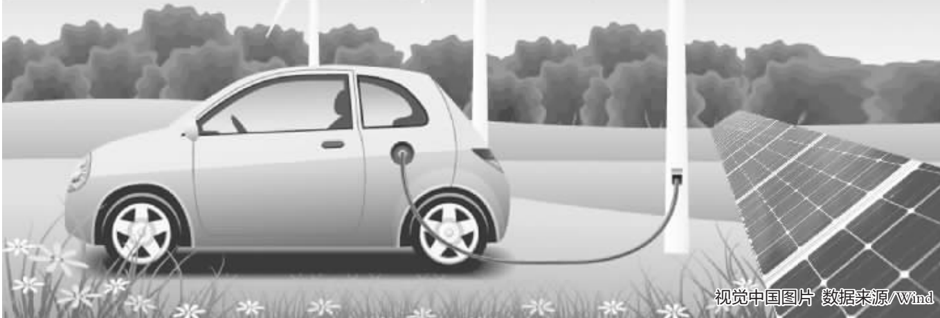
视觉中国图片 数据来源/Wind