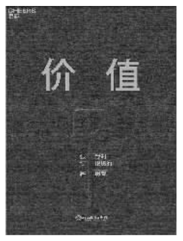
书名:《价值》 作者:张磊 出版社:湛庐文化/浙江教育出版社

A股市场有很多炒短线赚快钱的参与者,很多人说价值投资在中国是无效的,但张磊带领高瓴资本用过去15年的实践证明,以长期主义为导向的价值投资,在中国资本市场不仅是有效的,而且可以硕果累累。