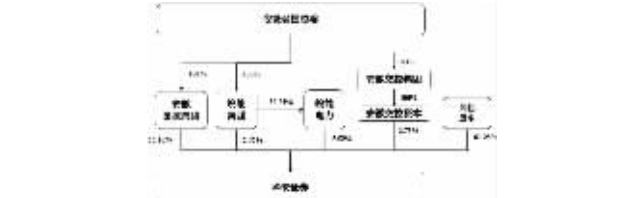
图 4-1 本次收购前

本次收购前，安徽国控集团直接持有华安证券909,020,879的股份，占华安证券总股本的25.10%；皖能集团直接持有华安证券96,620,222股股份，占华安证券总股本的2.67%；皖能集团的控股子公司皖能电力持有华安证券200,000,000股股份，占华安证券总股本的5.52%；安徽交控资本持有华安证券135,128,317股股份，占华安证券总股本的3.73%。安徽国控集团作为华安证券的控股股东，安徽省国资委为华安证券的实际控制人。本次收购前的股权结构如下：