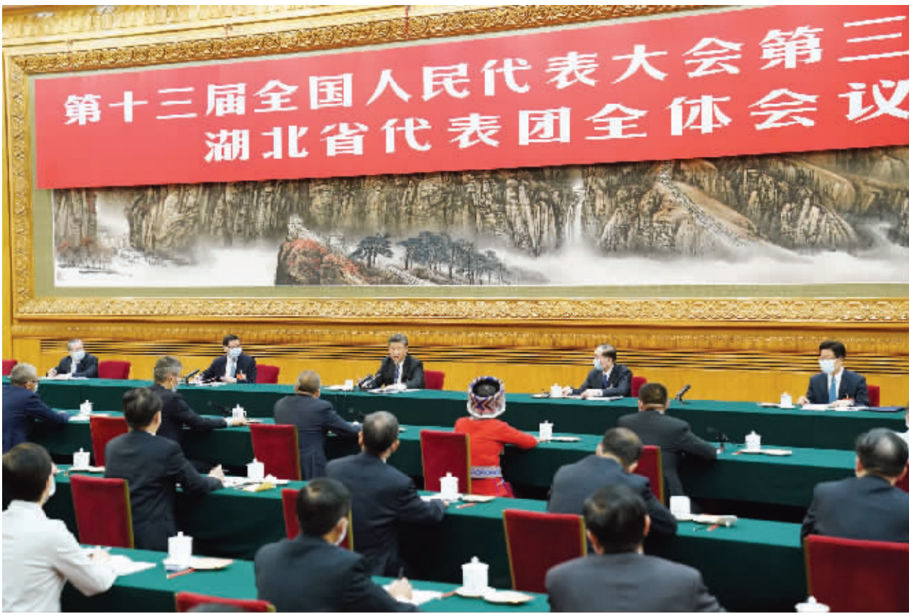
5月24日，中共中央总书记、国家主席、中央军委主席习近平参加十三届全国人大三次会议湖北代表团的审议。

习近平指出，作为全国疫情最重、管控时间最长的省份，湖北经济重振面临较大困难。同时，湖北经济长期向好的基本面没有改变，多年积累的综合优势没有改变，在国家和区域发展中的重要地位没有改变。党中央研究确定了支持湖北省经济社会发展一揽子政策。希望湖北的同志统筹推进疫情防控和经济社会发展工作，坚持稳中求进工作总基调，主动作为，奋发有为，充分激发广大干部群众积极性、主动性、创