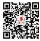
中国证券报微信号 xhszbb