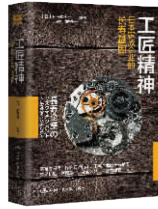
书名：《工匠精神：日本家族企业的长寿基因》 作者：[日]后藤俊夫 出版社：中国人民大学出版社