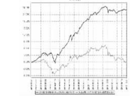
注:本基金于2012年9月21日成立,根据基金合同规定,基金合同生效后六个月内为建仓期,建仓期结束后各项资产配置比例符合法律法规和基金合同要求。