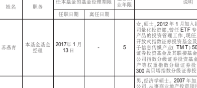
4.1 基金经理(或基金经理小组)简介