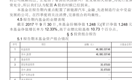
注:按照中国证监会规定,本基金自2016年9月30日起生效,自2016年9月30日起生效6个月内为建仓期,建仓期结束时各项资产配置比例符合合同约定。

4.2 异常交易行为的专项说明 本报告期内,所有投资组合参与的交易所公开竞价同日反向交易成交较少的单边交易不存在超过该证券当日成交量的5%的情况,对于一级市场证券申购、二级市场证券交易中出现的可能导致不公平交易和利益输送的重大异常交易情况,风控稽核部均根据制度要求组合经理提供相关情况说明予以留痕。