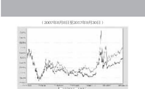
注:本基金建仓期为自基金合同生效日起的96个月。截至建仓期结束,本基金各项资产配置比例符合基金合同及招募说明书有关投资比例的约定。