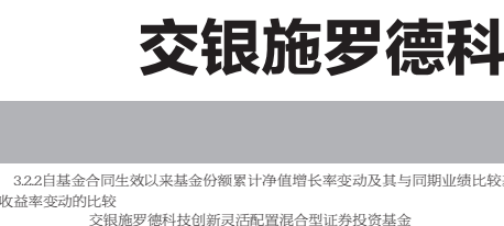
注:本基金基金合同生效以来基金份额累计净值增长率变动及其与同期业绩比较基准收益率变动的比较

交银施罗德蓝筹混合型基金证券投资组合 份额累计净值增长率与业绩比较基准收益率历史走势对比图