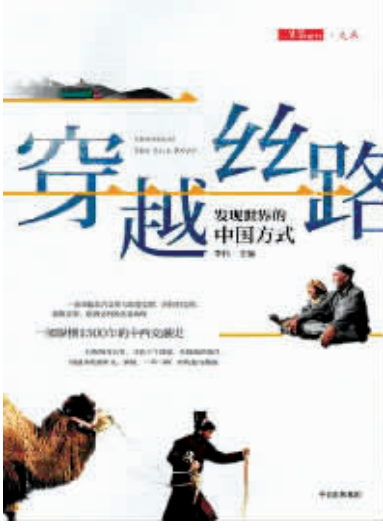
书名：穿越丝路 作者：李伟 出版社：中信出版社