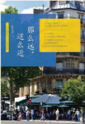
作者：陈思进 出版社：广东人民出版社