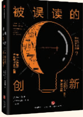
作者：凯文·阿什顿 出版社：中信出版集团