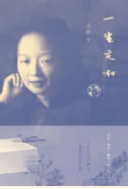
作者：王道 出版社：生活·读书·新知三联书店