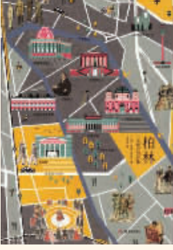
作者：罗里·麦克林 出版社：上海文艺出版社