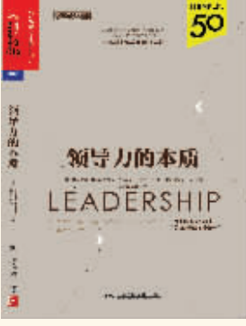
作者：斯图尔特·克雷纳 戴斯·狄洛夫 出版社：中国人民大学出版社