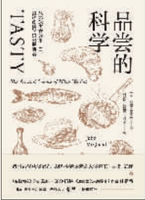
作者：约翰·麦奎德 出版社：北京联合出版公司