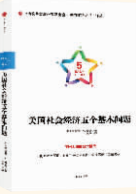
作者：詹姆斯·M.斯通 出版社：中信出版集团