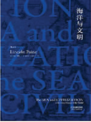
作者：【美】林肯·佩恩 出版社：天津人民出版社