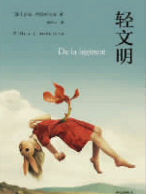
作者：【法】吉勒·利波维茨基 出版社：中信出版集团