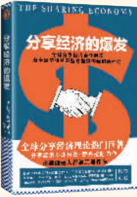
作者：阿鲁·萨丹拉彻 出版社：文汇出版社