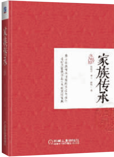
书名：《家族传承》 作者：张建华、薛梅 出版社：机械工业出版社