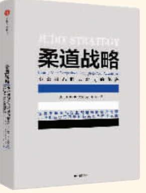
作者：【美】大卫·B.尤费 出版社：中信出版集团