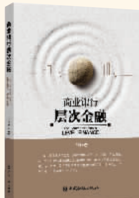
作者：马琳 出版社：中国金融出版社