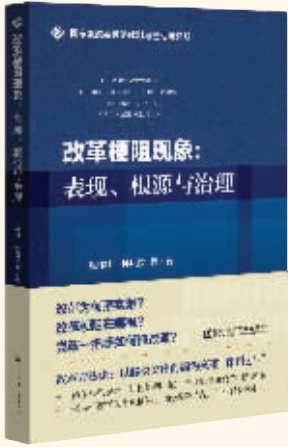
作者:张林山、孙凤仪 出版社:社会科学文献出版社