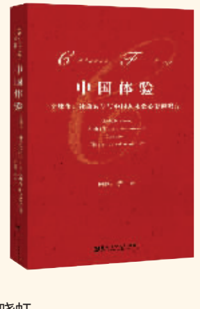
作者:周晓虹 出版社:社会科学文献出版社