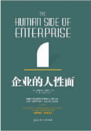
作者：〔美〕道格拉斯·麦格雷戈 出版社：北方妇女儿童出版社