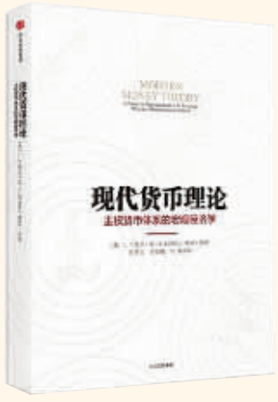
作者：〔美〕L.兰德尔·雷 出版社：中信出版集团