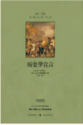
作者：〔美〕乔·古尔迪、大卫·阿米蒂奇 出版社：格致出版社