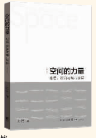
作者:陆绍 出版社:格致出版社