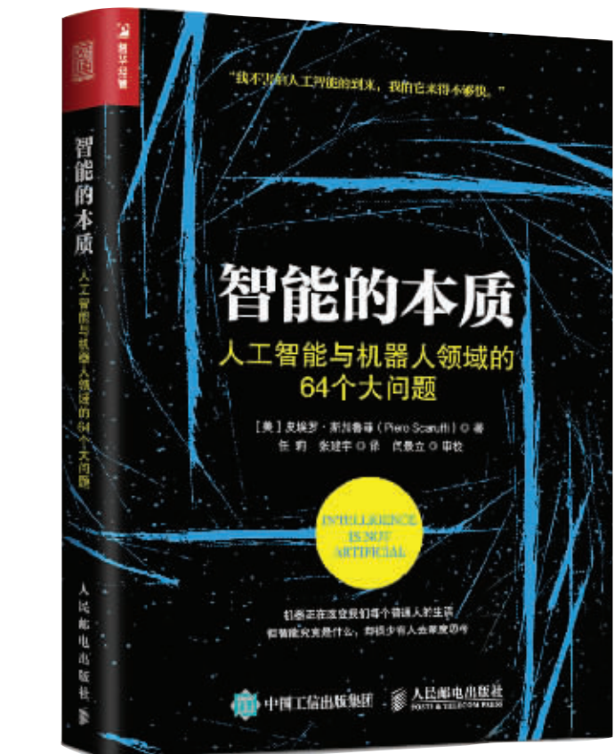
书名：《智能的本质》 作者：〔美〕皮埃罗·斯加鲁菲 出版社：人民邮电出版社

但从另一方面来说,在下棋这件事上机器智能战胜人类棋手,并不等于说机器智能就全面超过了人类。人的智能是多方面的,包括运动的智能、感知的智能、推理的智能、计算的智能、决策的智能和控制的智能等,是由一系列环节紧密协作、交互融合构成的。而机器博弈的胜利只能代表在问题空间表达和搜索推理