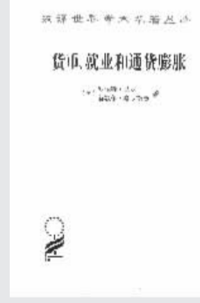
作者：【美】罗伯特·巴罗 赫歇尔·格罗史密斯 出版社：商务印书馆