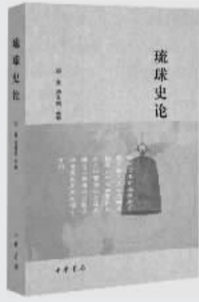
作者：汤重南 出版社：中华书局