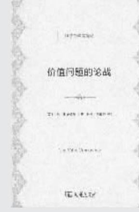
作者：【英】伊恩·斯蒂德曼【美】保罗·斯威齐 出版社：商务印书馆