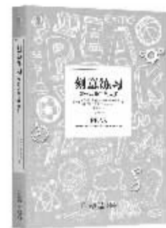
书名：《刻意练习：如何从新手到大师》 作者：【美】安德斯·艾利克森、罗伯特·普尔 出版社：机械工业出版社