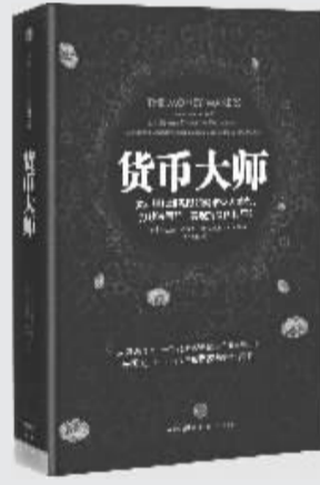
作者：埃里克·罗威 出版社：中信出版集团