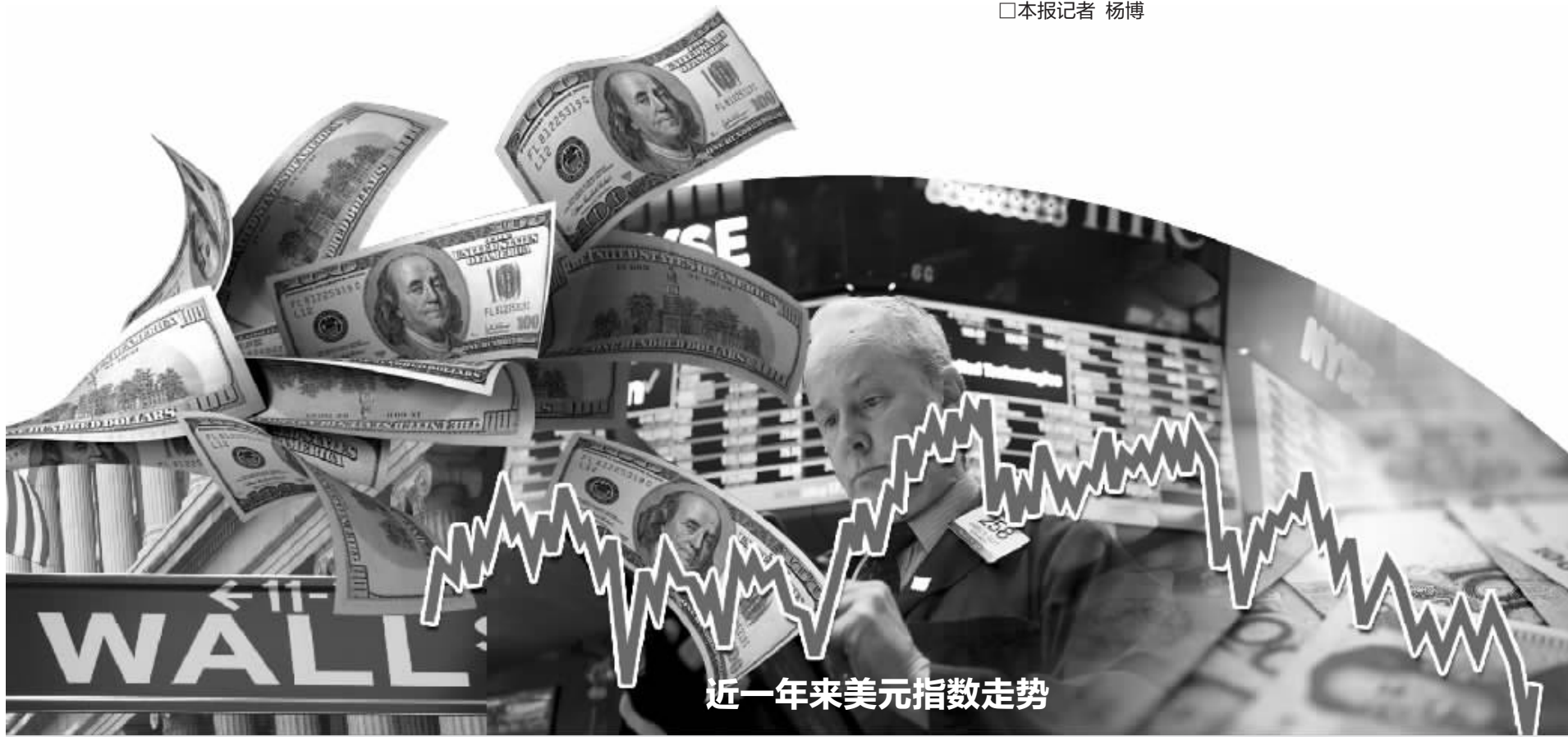
近一年来美元指数走势