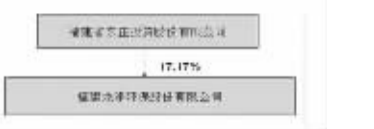
公司与实际控制人之间的产权及控制关系的方框图