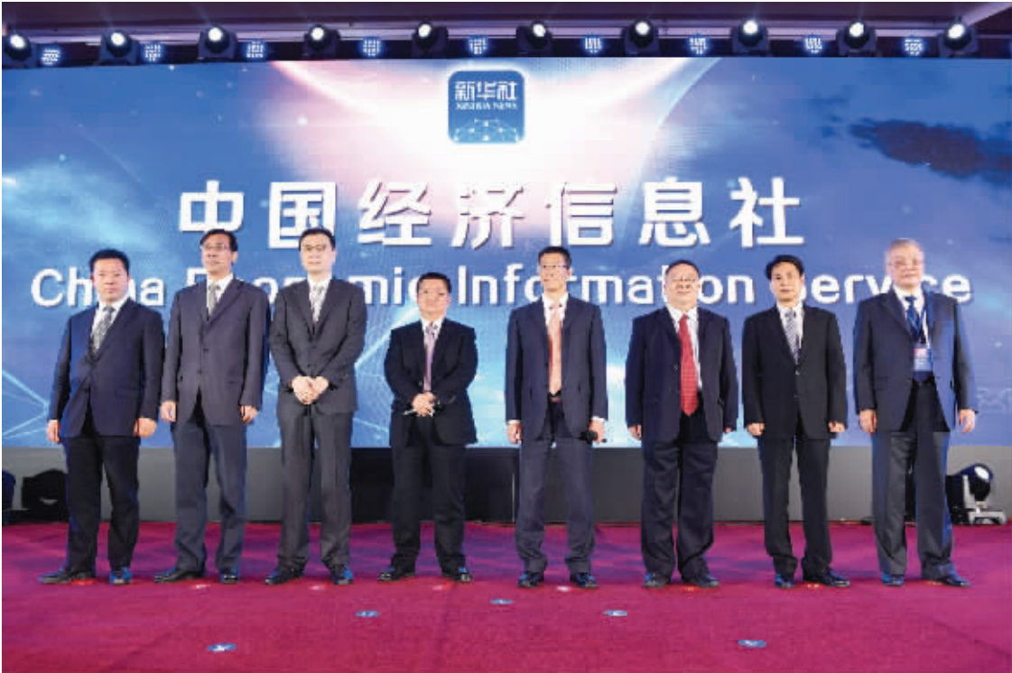
4月26日，中国经济信息社董事会成员集体亮相。