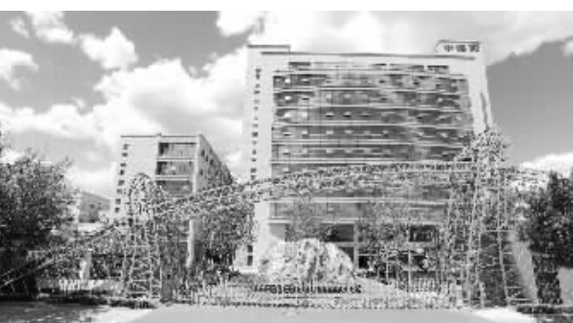
中海阳能源集团总部大厦

“能源互联网不仅将会使我国的能源生态发生翻天覆地的变化,也是能源、互联网等企业面临的重要发展机遇。作为长期深耕太阳能发电及光热创新综合利用的企业,中海阳将致力于在能源互联网的大潮中做弄潮儿,为推动能源领域供给侧结构性改革做出贡献。”中海阳负责人如是说。