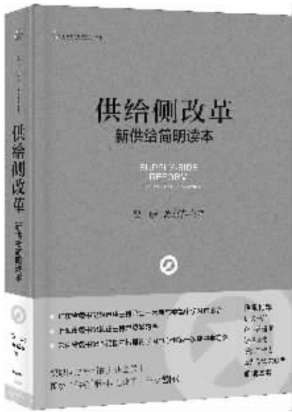
书名：《供给侧改革：新供给简明读本》 作者：贾康 苏京春 出版社：中信出版社

供给侧结构性改革的理论基础是新供给经济学。早在2012年初，贾康等七位学者就发表长文，首次提出中国需要构建和发展以改革为核心的新供给经济学。2013年春，华夏新供给经济学研究院、新供给经济学50人论坛成立。三年来，新供给的相关研究取得了突飞猛进的进步，为后来进入决策层视野奠定了扎实基础。新供给经济学有着强大的中国基因，供给侧结构性改革更是以习近平同志为总书记的党