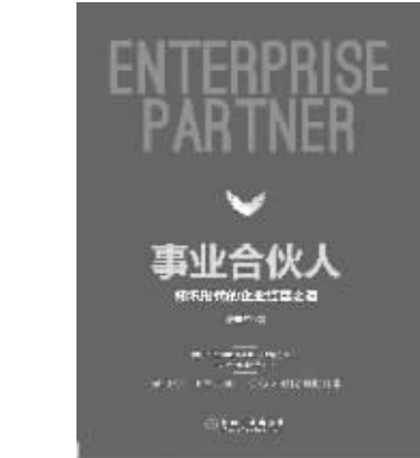
书名：《事业合伙人：知识时代的企业经营之道》 作者：康至军 出版社：机械工业出版社

万科实践的“事业合伙人制度”，主要是通过股票跟投和项目跟投的方式，实现利益的捆绑。目前正在进一步扩大化，试图将产业链上下游也变成事业合作伙伴。并希望在新机制驱动下，打破原来的职业经理人的科层化、责权化和专业化的窠臼，从金字塔式的组织机构转变为扁平化结构，实现共创、共享、共担的分享机制与建立新型房地产生态系统，搭建平台式架构