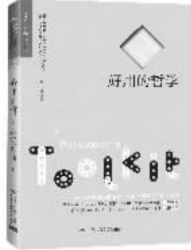
作者：朱利安·巴吉尼，彼得·福斯 出版社：中国人民大学出版社 内容简介：

《好用的哲学》收集与汇总了哲学进行区别、论证及批判的工具，也讲述了哲学的局限性，涵盖了著名哲学家提出的前沿概念和原则。文中配以哲学大师的肖像，让哲学不再枯燥，使阅读充满乐趣。更重要的是，让你也可拥有推理大师般无懈可击的逻辑思考能力。