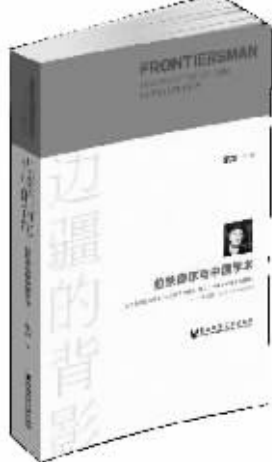
作者：袁剑 出版社：社会科学文献出版社 内容简介：

他是一个从小在中国长大的美国孩子，一个曾经脚足了劲想要考牛津大学的懵懂少年，一个在商行工作中发现边疆与内亚魅力的青年人，一个与新婚妻子度过一整个“蜜月年”的丈夫，一个跟埃德加·斯诺、费正清等建立起终生友谊的学者，一个曾经拜访过延安的美国友人，一个首次将中国内陆边疆地区进行区域性划分的西方研究者，一个被麦卡锡主义迫害而不得不远走他国的学问家，一个在耄耋之年应邀访华的老朋友。他是边疆与内亚研究领域的拓荒者，也是国际关系与地缘政治方面的思想者，更是20世纪国际风云变幻的见证者之一，他就是欧文·拉铁摩尔。