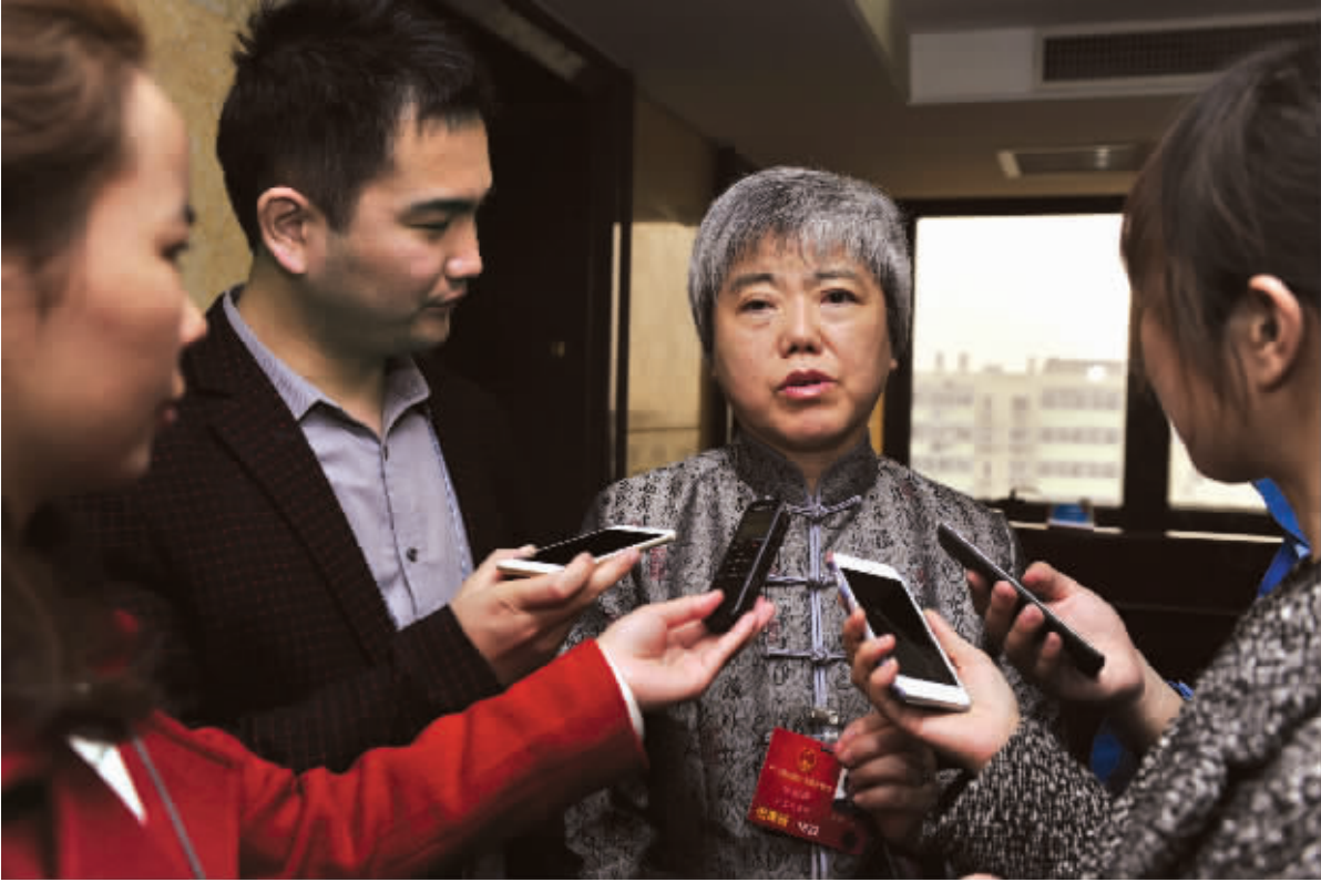
全国人大代表、深交所总经理宋丽萍(左三)接受记者采访。

宋丽萍表示,要支持这类公司成长,把资源整合入其中,提高公司质量。这既符合国家战略,又能满足消费者需求,实现消费升级,达到多赢的结果。“创新是引领发展的第一生产力。深交所的创业板做了很多年,对于创新带来的生产力是深有体会的,也应该提供条件支持创新型企业。”