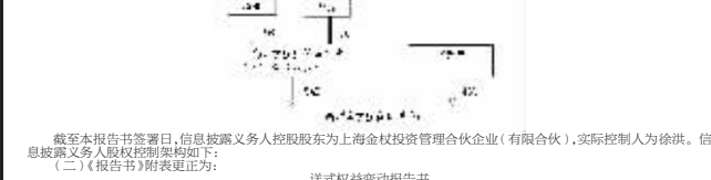
截至本报告签署日,信息披露义务人控股股东为上海金茂投资管理合伙企业(有限合伙),实际控制人为徐洪。信息披露义务人股权结构关系如下: