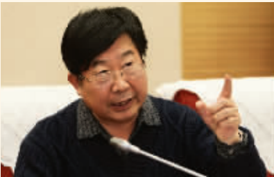
中国企业改革与发展研究会副会长李锦