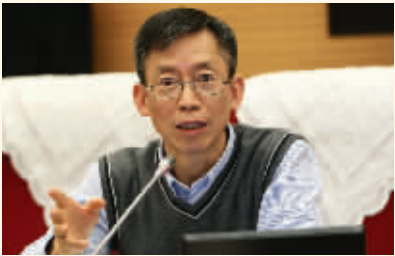
上交所前首席经济学家胡汝银