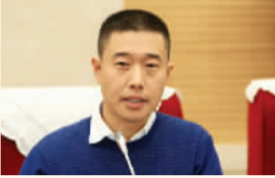
国务院发展研究中心刘培林