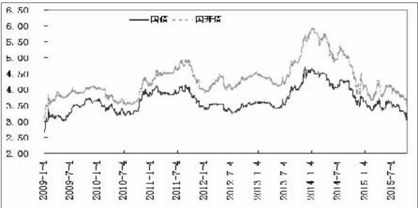
十年期国债和国开债收益率

市收益率向下仍是有底的。中金公司的报告指出,宏观去杠杆没有完成甚至才刚开始,当前更多是杠杆的转移,尚未看到资产负债表收缩,且未来加杠杆将更多依靠中央政府。这意味着,未来无风险资产不会稀缺,利率向下有底。有银行交易员也指出,中国正在步入低利率时代,利率降低是长期趋势,但并不意味着会一步到位降至最低,中间走势可能会有反复。由此分析,当前债券利率不断下行,即不断接近阶段性底部的过程。