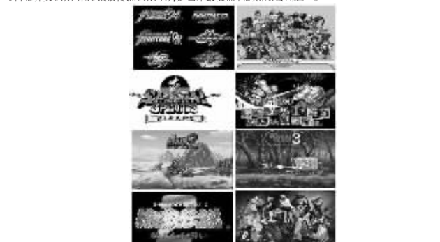
SNK Playmore近期主要产品一览(手游、iOS平台):