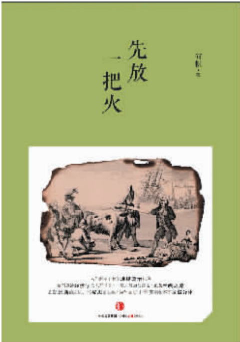
书名:《先放一把火》 作者: 何帆 出版社: 中信出版社

事实上, 作者这些写作的思路和逻辑对于我们理解中国的现实问题和未来前景同样至关重要。作者终成此书于他是一次宝贵的学习与写作机会; 而于北大光华之外的人而言, 相信借此既能系统吸收北京大学光华管理学院的人文智慧, 也能够更深刻了解中国的现实和未来。