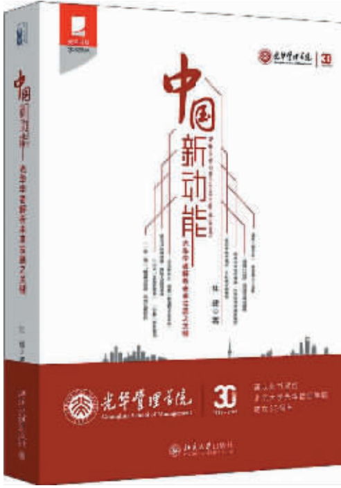
书名:《中国新动能——光华学者解析未来发展之关键》 作者: 焦建 出版社: 北京大学出版社

当然, 这些名师大家不可能只有批评而没有建议, 只是正如曹凤岐教授所言“我们要谈成绩, 当然也不能讳言毛病”。针对目前中国人力资本存量并无优势的现状, 陈玉宇副教授提出国家应继续加大教育投资, 包括更加广泛地推广基础教育, 义务教育应该改为12年, 现在已经展开的高校扩招不要因为暂时的困难而放缓。对于在中国城镇化发展过程中最受关注也难以克服的户籍制度改革, 朱善利教授提出未来中央及各个地方应该加强落后中小城镇建设, 增加经济投入缩小城乡差距。同时, 城市应该逐步把那些福利的增量、地方公共产品的增量向那些非户籍的常住人口倾斜。对于解决中国经济和金融体系微观机制上的一系列结构性问题, 曹凤岐教授建议中国金融监管机构的设置应当实行“一行一会”结构, 即中国人民银行继续监管货币市场和外汇市场, 同时成立直属国务院的中国金融监督管理委员会, 将银监会、证监会、保监会的监管职能合三为一。为了更好