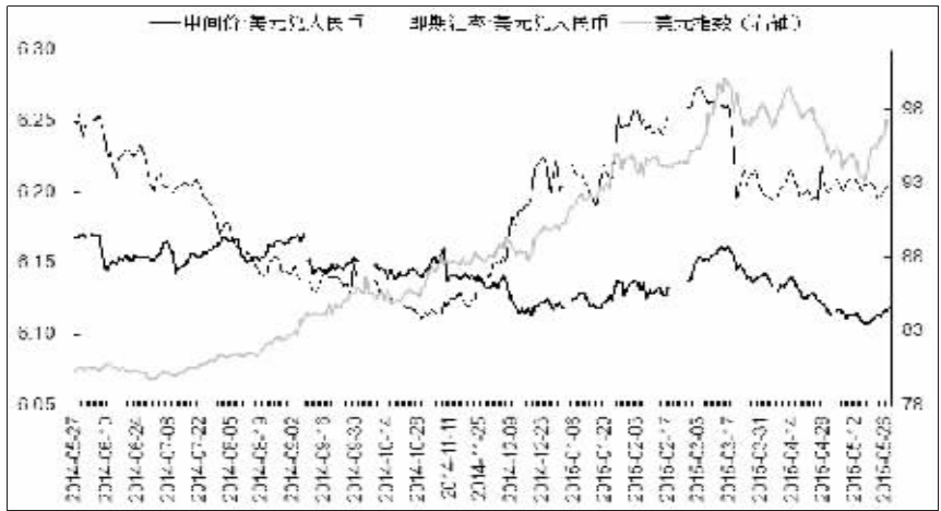
美元兑人民币汇率中间价、即期价与美元指数

据外汇交易中心公布,2015年5月27日银行间外汇市场上人民币兑美元汇率中间价报6.1198,26日的6.1172小幅下调26基点。至此,该中间价连续第三个交易日温和走软,并刷新了4月28日以来的接近一个月新低。不过,从4月末至今的整体表现来看,虽然人民币中间价在5月中旬一度接近6.10的高位,但基本