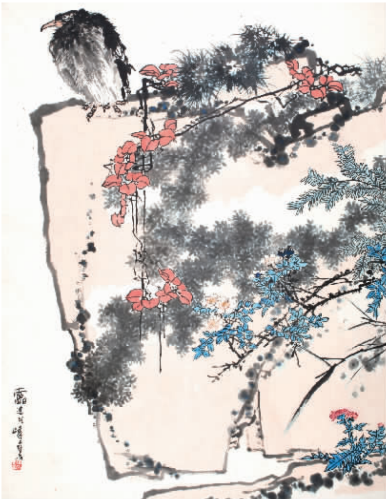
潘天寿 鹰石山花图 2.7945亿元成交

有趣的是,在这一个多小时内,艺术界的微信朋友圈中被这幅作品的激烈竞拍刷屏,几乎每个现场观众都从自己的角度尽职地汇报每一轮竞价,最后一位观众在自己的圈内兴奋地说道:“经过我自己都数不清的竞价后,它终于成交了。”收藏大鳄刘益谦也马上在自己的微信中澄清: