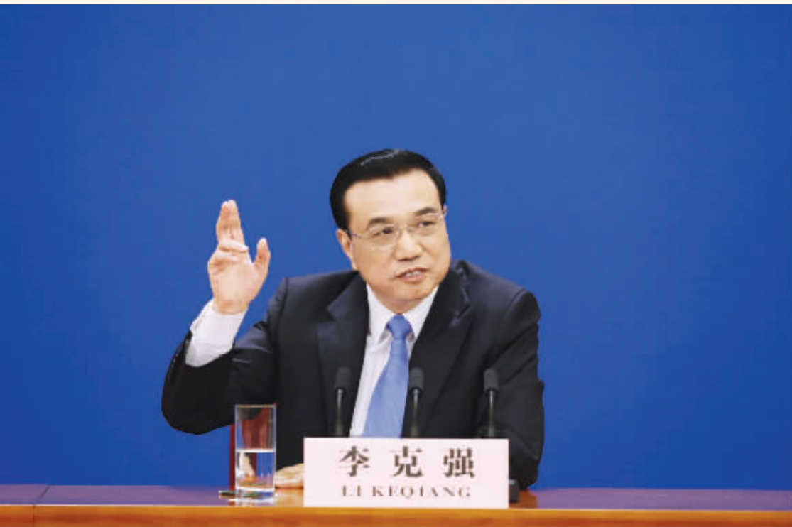
图为国务院总理李克强在北京人民大会堂与中外记者见面,并回答记者提问。