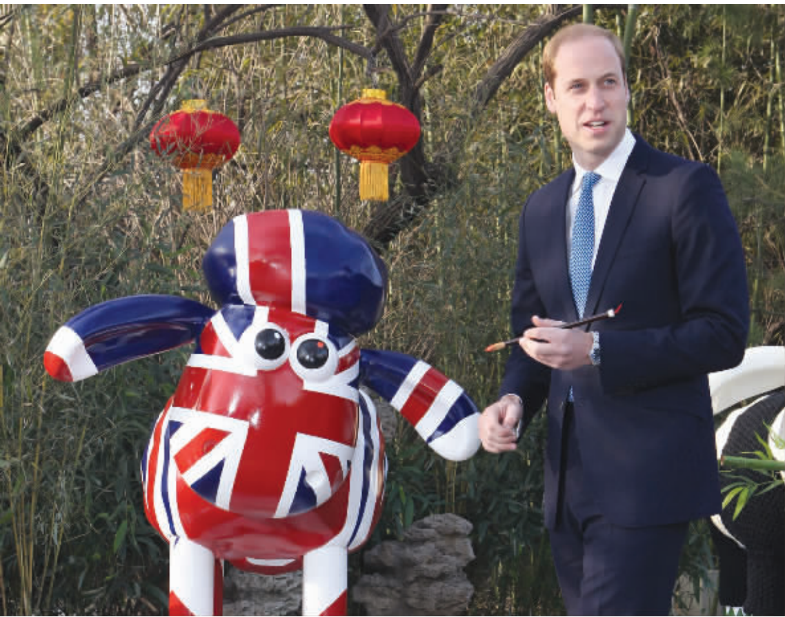
威廉王子正在给“小羊肖恩”点睛。

在包括原版在内的两只英国艺术家设计的“小羊肖恩”以外,还有三只由中国知名艺术家徐冰领衔,以“小羊肖恩”为原型,加入中国元素后创作的中国版“肖恩”。其中,徐冰创作的“肖恩”具有羊的身体,熊猫的样子。徐冰解释说,作品中“肖恩”把自己打扮成一只熊猫,它