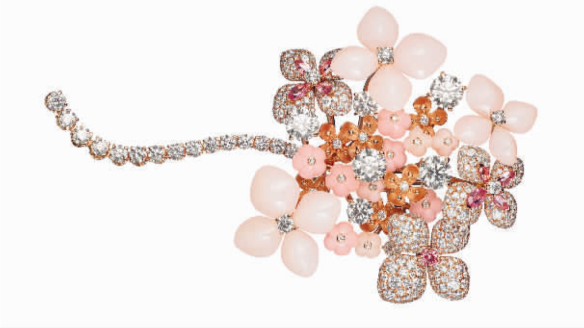
CHAUMET HORTENSIA 绣球花高级珠宝 玫瑰金镶钻胸针

世纪的欧洲艺术领域，出现了与文艺复兴时期单纯、和谐、稳重，背道而驰的繁复、扭曲、夸张的豪华、绚丽的风格，在文学、美术、音乐、建筑乃至服饰上都产生巨大的影响，在首饰设计上更是展露无遗，富有张力的曲线、包含延展的斜线，被淋漓尽致地使用在钻石项链上。