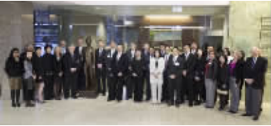
麦迪舜医疗团队在梅奥总部培训

进的医疗机构,结合香港健全的法律体系及对中国市场的经验,采用梅奥先进的医疗管理体系和技术,为中国及亚洲患者提供更优质的服务。同时麦迪舜集团将进一步开发由梅奥专家发明的居世界领先地位的治疗缺血性心力衰竭产品C-Cure®,在中国联合