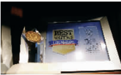
2014年梅奥诊所被评选为全美医院综合排名第一及8个专科排名第一

虽然现在马先生的诊疗过程还没有结束,但是他多次对麦迪舜团队说,你们让我完全没有那种在国外又不会说当地语言的无助感,你们就像我亲朋一样帮着我,我很开心。 —CIS—