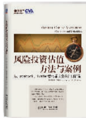
作者:洛伦佐·卡弗 出版社:机械工业出版社 内容简介:

本书系统深入地介绍了风险投资交易的整个过程,并围绕交易双方、交易动机和风险投资资金如何运作等内容展开。此外还涉及了一系列相关的内容,包括价值如何评估确定、风险投资人可能会面临哪些影响企业运营的外部效应等。