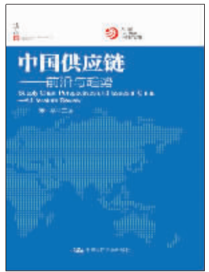
作者:宋华 主编 出版社:中国人民大学出版社 内容简介:

理解中国供应链,对全球的企业家和政府来说极其重要。在这个互相联系和改变迅速的世界,任何人都不能忽略中国企业如何塑造全球价值链。