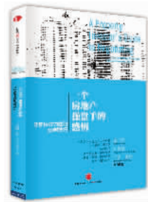
作者:约翰·波特 出版社:中国人民大学出版社 内容简介:

澳大利亚最卓越的房地产商之一、澳大利亚波特集团创始人将其35年房地产谈判、操作经验倾囊相授。