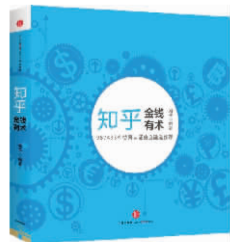
书名:《知乎:金钱有术》 作者:知乎 出版社:中信出版社