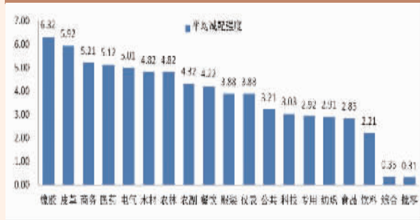
上周各类型基金仓位(截至1月9日)