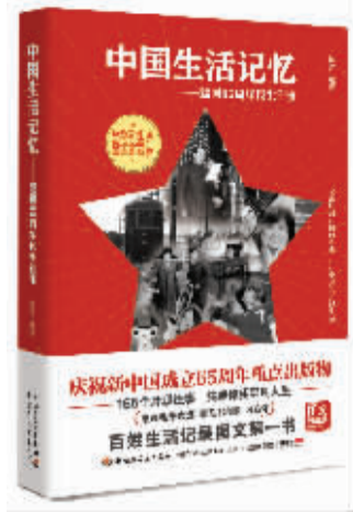
书名:《中国生活记忆——建国65周年民生往事》 作者:陈焯 出版社:中国轻工业出版社