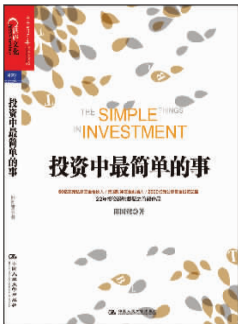
书名:《投资中最简单的事》 作者:邱国鹭 出版社:中国人民大学出版社

在从业炒股者成长为职业投资人的过程中,我在不同的阶段钻研过各式各样的投资方法:从打探消息、跟庄炒作,到定量投资、程序化交易;从看K线图的技术分析,到看财务报表的基本面分析;从精选个股的集中投资,到行业配置的组合投资;从寻找未来收入爆发的成长投资,到专注现有资产低估的价值投资。这期间我