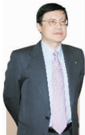
连平 交通银行首席经济学家

近期,房贷政策放松等稳增长举措陆续出台,交通银行首席经济学家连平接受中国证券报记者专访时称,房贷新政有利于前期受政策抑制的需求陆续释放,但是要实现全年经济增长目标,应保持社会融资适度增长,以不低于18.5万亿元为宜,年内存在适度增加信贷投放的空间。