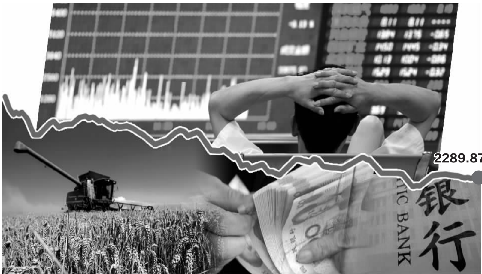
制图/韩景丰

新股密集发行、经济增速回落预期以及获利回吐压力，令短期市场乐观情绪有所减弱，沪综指2300点位置的宽幅震荡有望延续。分析人士认为，考虑到10月是重要政策预期节点，势必会给9月股市提供明显支撑，预计9月行情将有惊无险的方式收官。