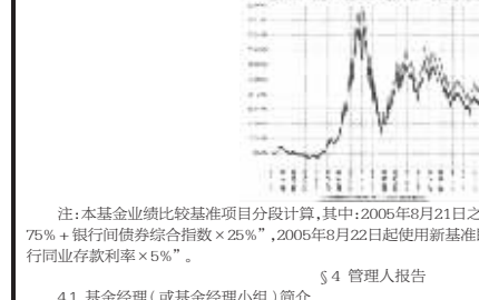
注:本基金业绩比较基准项目分段计算,其中:2005年8月21日之前(含此日)采用“深证100指数×75%+银行间债券综合指数×25%”,2005年8月21日起使用新基准“深证100指数收益率×95%+银行间存款利率×5%”。