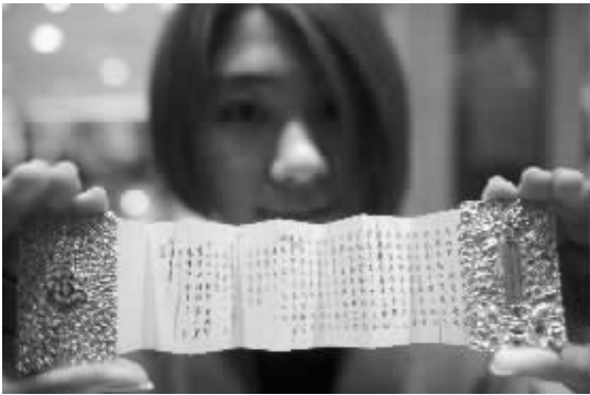
日前,“失吉祥金”贵金属系列在莱百上市。该系列贵金属具有藏文化特色。