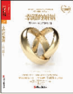
作者:(美)约翰·戈特曼,娜恩·西尔弗 出版社:浙江人民出版社

内容简介: 这是一本婚姻教皇、人际关系大师、著名心理学家约翰·戈特曼揭开男女长期相处之道的经典作品,向我们阐释了为什么婚姻有时如此艰难,为什么有些人能够厮守一生,而有些人则像躲避定时炸弹一样躲避婚姻生活?如何防止婚姻危机,又如何拯救一段已经出现危机的婚姻?