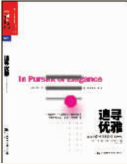
作者:(美)马修·梅 出版社:中国人民大学出版社 图书品牌:湛庐文化

内容简介: 本书是“少即是多”新思维方式的行动指南,创造性地提出了极具价值的优雅四要素:对称、诱惑、精简、不朽。我们生来都是添真之道的依附者,本书告诉我们“减法”是成就优雅最基础性的一条法则,是“对称”和“诱惑”所倚仗的法上法。“减”,未必就是想尽办法做得少,而是尽力优化和最大程度上发挥资源和资产的效用。这个世界的每样事物都越来越复杂,越来越让人眩晕,本书让我们看到,如果能删除、停止做某些事情,学会聪明地适可而止,我们就会更快乐、把工作做得更好,世界也会更美好。