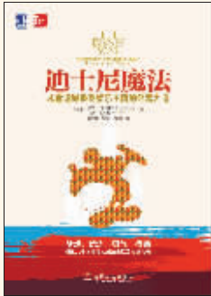
作者:(美)比尔·卡波达戈利,林恩·杰克逊 出版社:机械工业出版社

内容简介: 迪士尼是一个用魔法搭建起来的神奇世界,很多人对它获得如此巨大成功的方法十分好奇。经过十多年时间的搜集和研究,本书作者发现,迪士尼的成功其实源于八个字:梦想、信念、勇气、行动。本书详细介绍了迪士尼获得成功的方法,分享了大量践行该方法获取成功的企业经验,希望可以为所有想要借助迪士尼魔法获取成功的人提供借鉴。