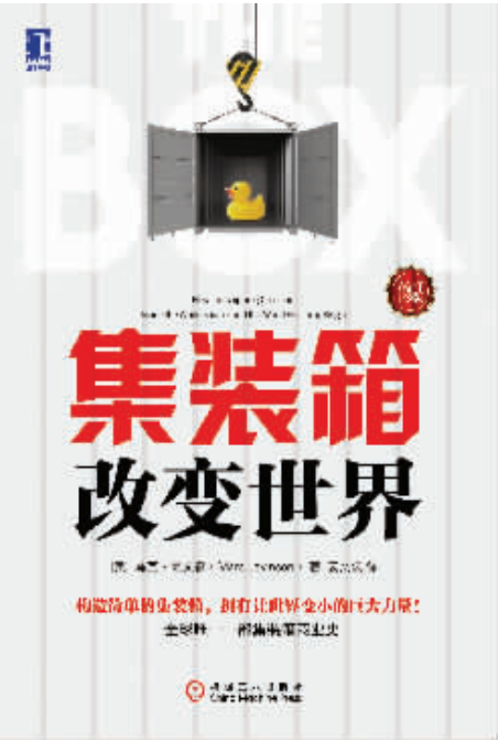
书名:《集装箱改变世界》 作者:(美)马克·莱文森 出版社:机械工业出版社

“晋升版本”。实践证明,很多因技术、业务能力突出而一路向前的经理人,在晋升到职场高位时,突然从曾经的职场明星沦为众矢之的,其主要原因便是他的职业能力没有与时俱进,仍停留在专业技术掌控一切的阶段,而忽略了作为领导者应具备“成就事情的能力、亲和力、感召力以及可信度”四种特质。