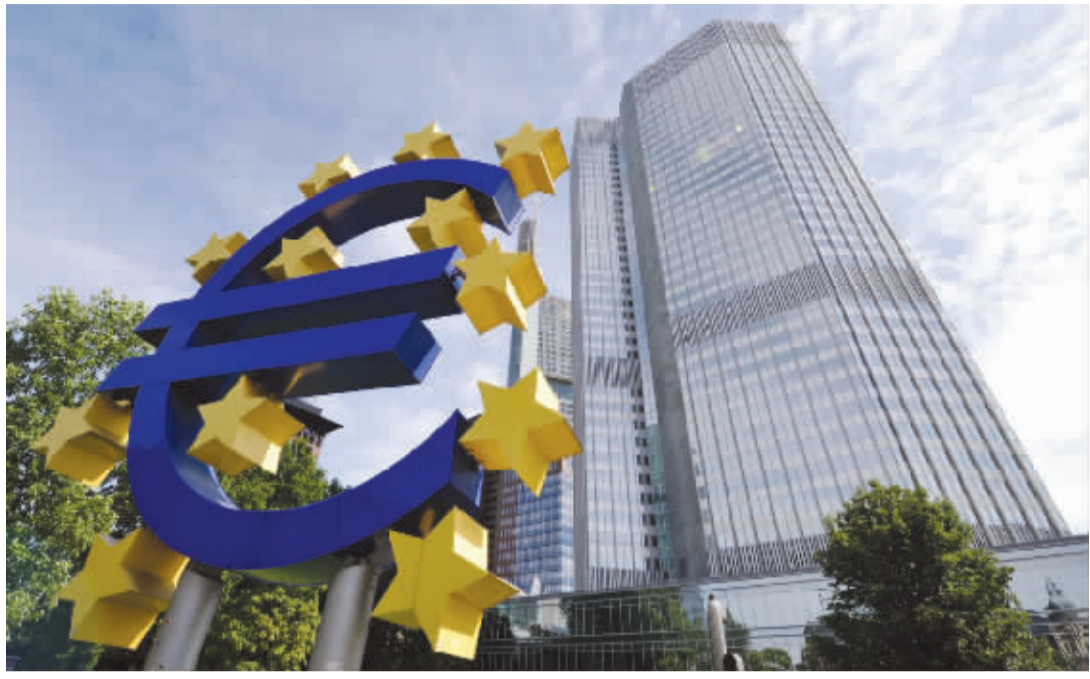
位于法兰克福的欧洲央行大楼

分析人士预测称,目前英国央行正考虑效仿美联储,围绕何时和何种环境下开始收紧其货币政策向外界提供前瞻指引。新任英国央行行长卡尼(前加拿大央行行长)已力主推出该计划,因为