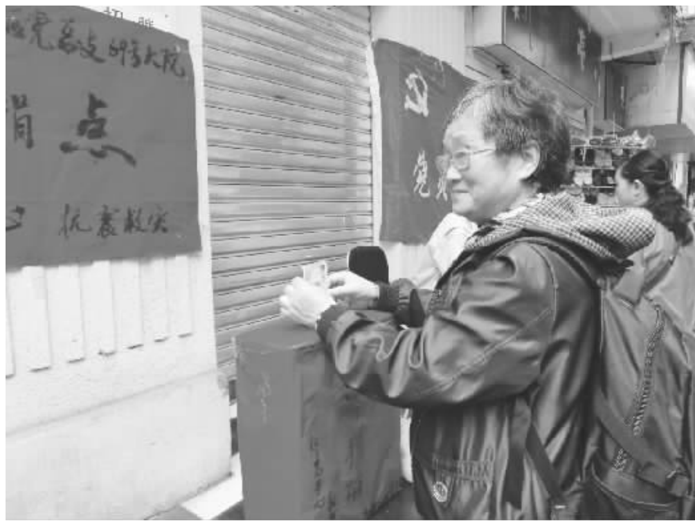
雅安市雨城区新康路社区组织党员突击队募捐。

会议强调,政府工作千头万绪,必须围绕大局,统筹兼顾。要在及时高效、科学有序应对自然灾害、公共卫生突发事件等的同时,继续抓好稳增长、推改革、促升级等各项重点工作。