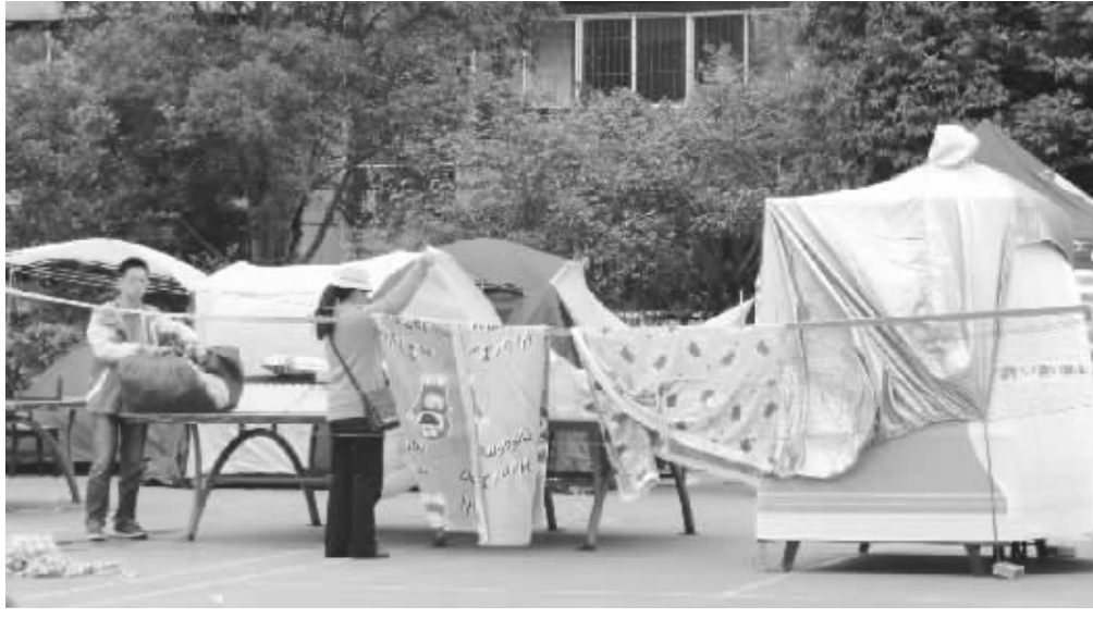
雨夜过后,住在帐篷内的灾区群众晾晒被褥。