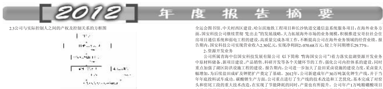
2.3 公司与实际控制人之间的产权及控制关系的方框图