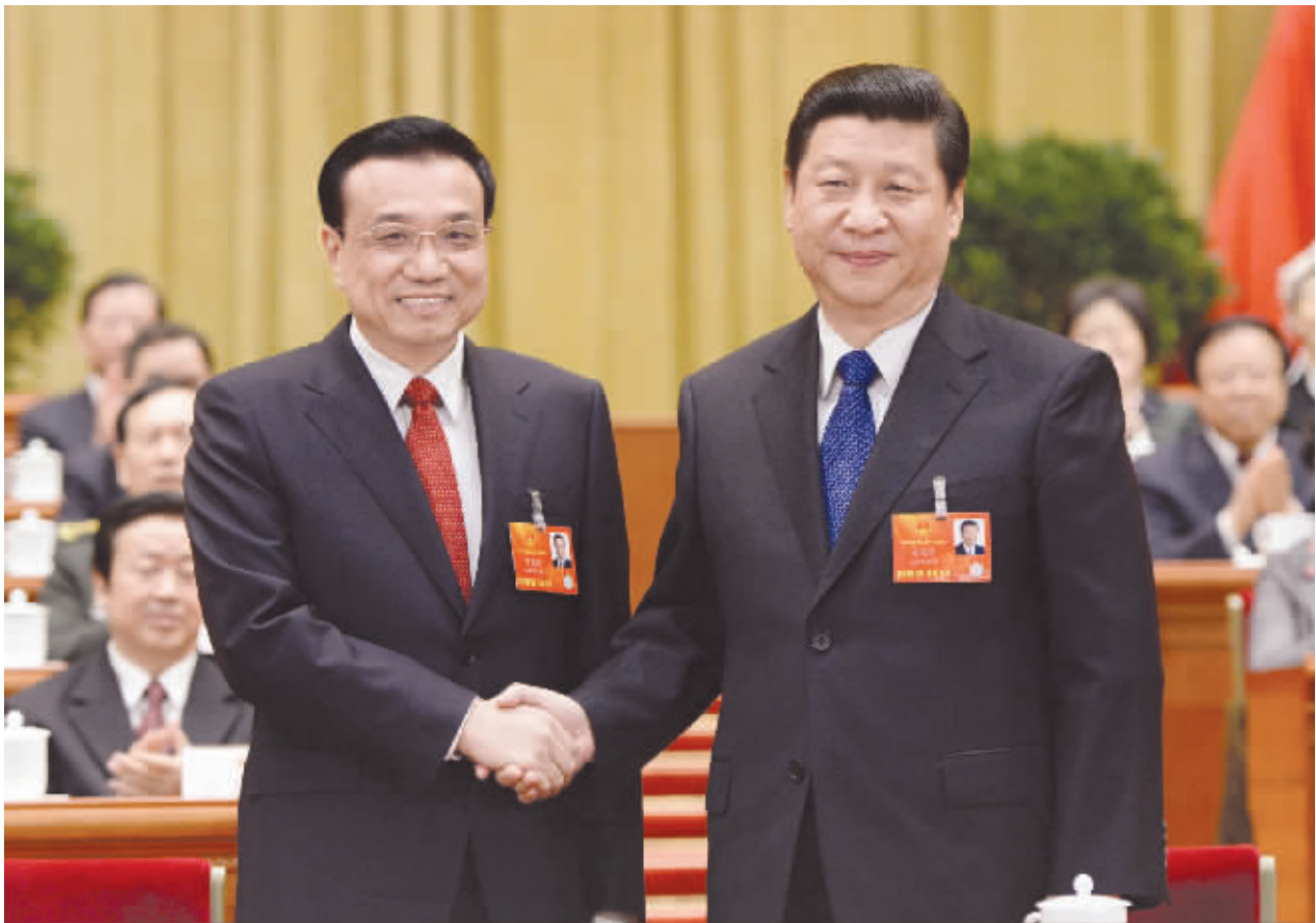
习近平同李克强亲切握手。

最高人民法院院长的人选，最高人民检察院检察长的人选，主席团提名后，各代表团进行了酝酿协商。根据多数代表的意见，主席团会议确定了正式候选人名单，提请大会全体会议选举。