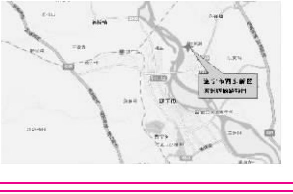
图5:遂宁市河东新区五彩缤纷路项目