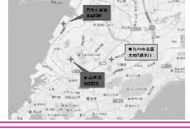
图2:长春市西新开发区西湖大路项目