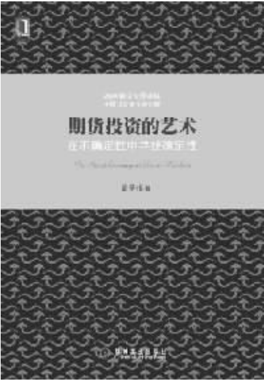
出版社:机械工业出版社 作者:黄圣根 书名:《期货投资的艺术》