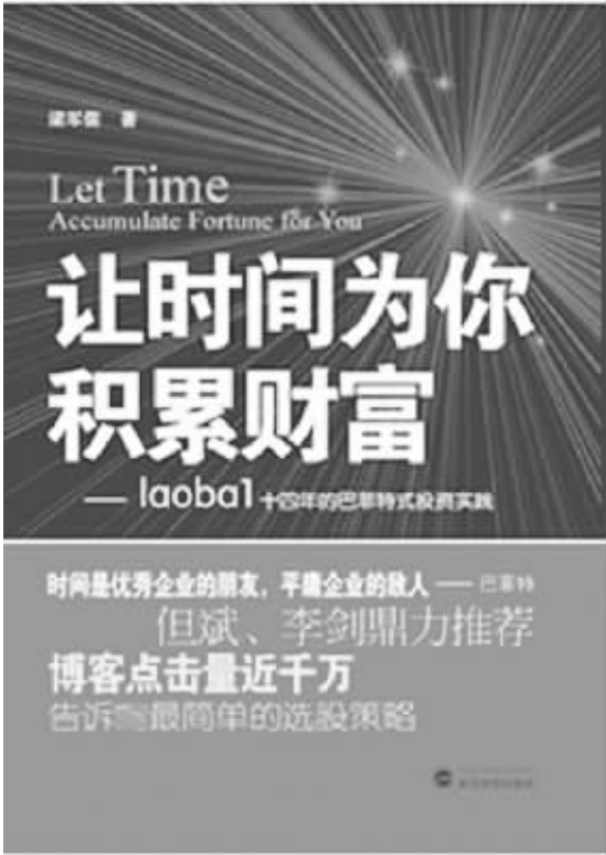
出版社:武汉大学出版社 作者:梁军儒 书名:《让时间为你积累财富》

面,这与圈中的一众好友结识相仿,我们无意间读到对方的文字,便认定彼此同道。在军儒的《让时间为你积累财富》面市之前,我就看过她的一些博文,那种感觉,正如我在《铁南钻石计划投资入书》中所提到的:我遇见过从未谋面却一见如故的人。”胸中若有默契,见不见面又何妨。