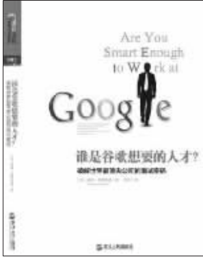
作者:(美)威廉·庞德斯通 出版社:浙江人民出版社 内容简介:

如果你被缩小到一枚硬币大小,扔进搅拌机,你的质量减少,密度不变,搅拌机片60秒内就会开始搅拌。你会怎么办?有6个数字:10、9、60、90、70、66,接下来该出现什么数字?请代拟一份合同,内容是“把谷歌联合创始人谢尔盖·布林的灵魂卖给魔鬼”,合同必须在30分钟内发到布林的邮箱。刽子手让100名囚犯排成一列,并让每名囚犯戴上一顶红色或蓝色的帽子。每名囚犯都可以看到自己前面人头上戴的帽子,但他看不见自己的,也看不见身后其他人的。刽子手从队列最末尾的地方开始,询问最后一名囚犯他所戴帽子的颜色,他只能回答“红”或“蓝”。如果回答正确,他就能活下来。如果他给了错误的答案,那就立刻被无声无息地杀掉。列队行刑的前一天晚上,囚犯们要琢磨出一套能够自救的策略来。他们应该怎么做?